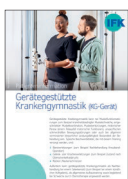
Gerätgestützte Krankengymnastik (KGG)