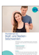
Physiotherapie bei Kopf- und Nackenbeschwerden