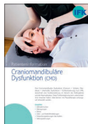
Craniomandibuläre Dysfunktion (CMD)