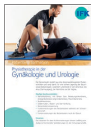
Physiotherapie in der Gynäkologie und Urologie