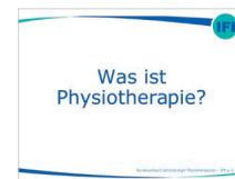
IFK-Präsentation: „Was ist Physiotherapie?“ für IFK-Mitglieder kostenlos