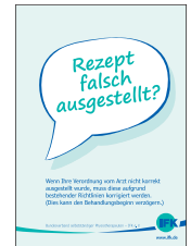
Rezept falsch ausgestellt