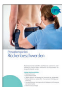
Physiotherapie bei Rückenbeschwerden