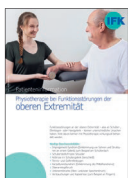
Physiotherapie bei Funktionsstörungen der oberen Extremität