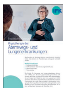
Physiotherapie bei Atemwegs- und Lungenerkrankungen