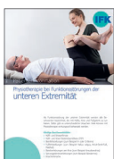
Physiotherapie bei Funktionsstörungen der unteren Extremität