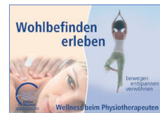
Poster: „Wohlbefinden erleben“