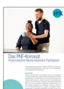
Propriozeptive Neuro-muskuläre Faszilitation