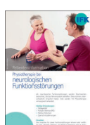
Physiotherapie bei neurologischen Funktionsstörungen